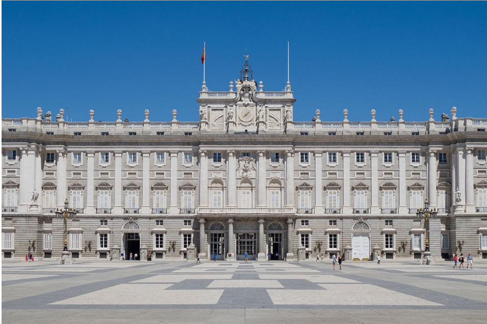
Fachada del Palacio Real de Madrid. Planos de Juvara y Sacchetti. 1734