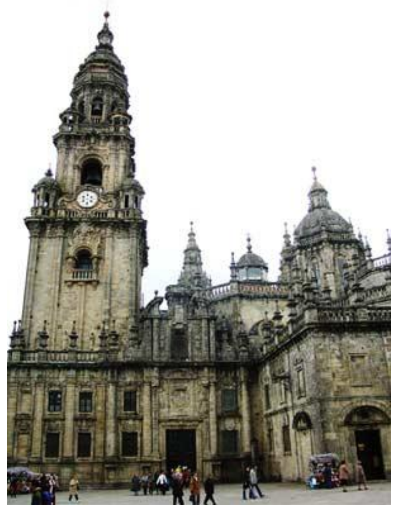
Torre del Reloj de la catedral de Santiago. Toro y Andrade