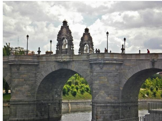
Puente de Toledo