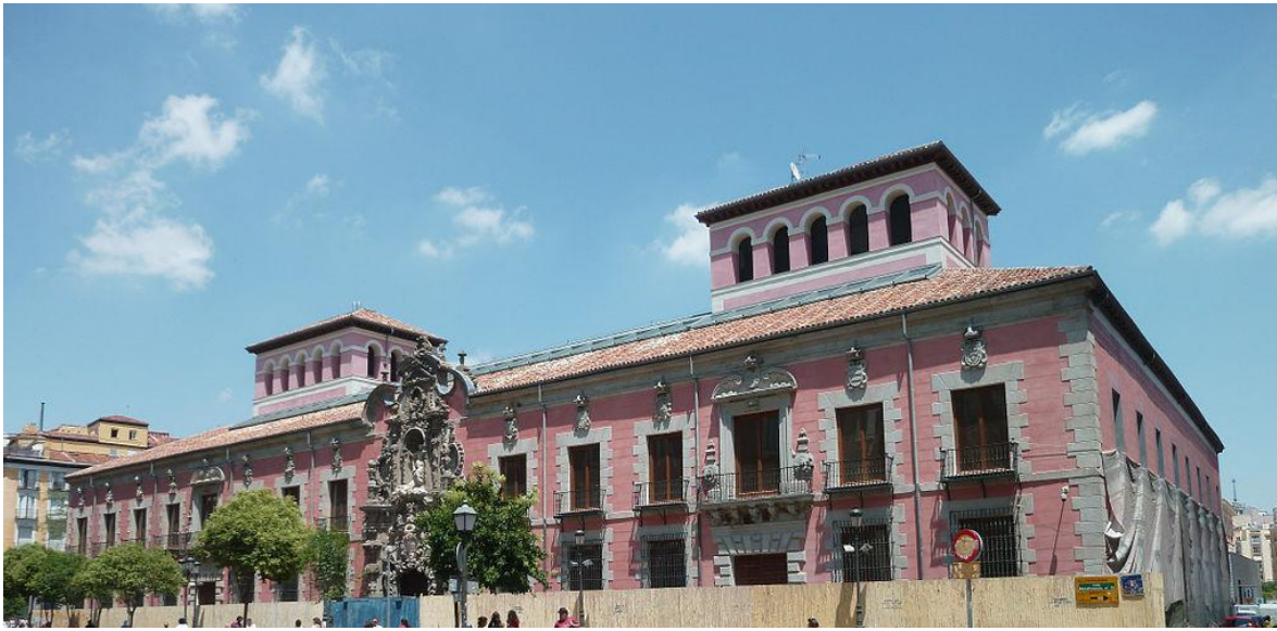
Real Hospicio de Madrid. Pedro de Ribera. 1721-1726