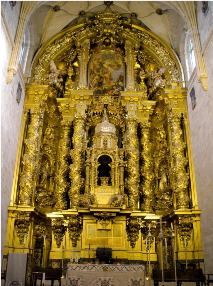
Retablo de San Esteban. Benito Churriguera. 1692