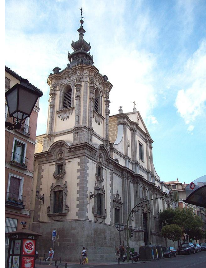
Iglesia de Nuestra Señora de Monserrat. Madrid. Pedro de Ribera. 1720