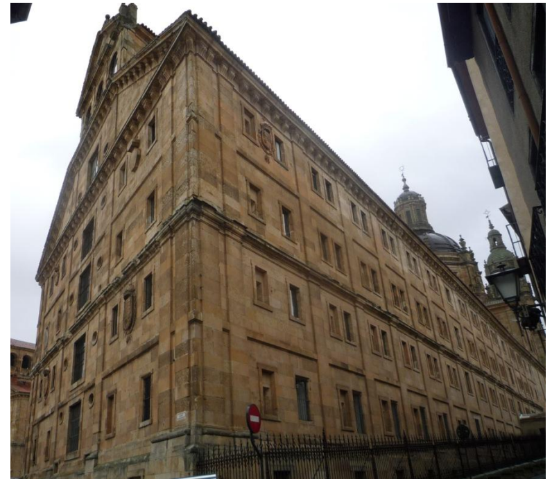
Clerecía de Salamanca. J. Gómez de Mora Comienzan las obras en 1617.