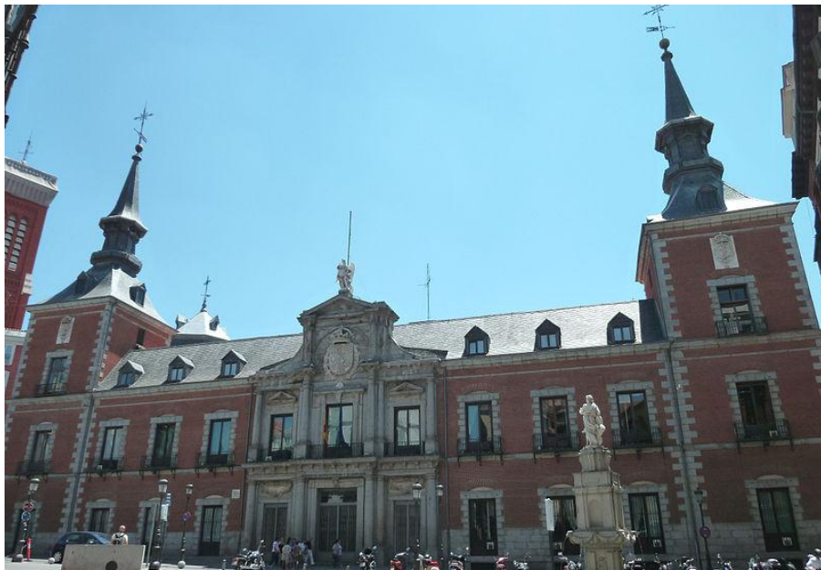
Palacio de Santa Cruz. Juan Gómez de Mora. 1629-1636