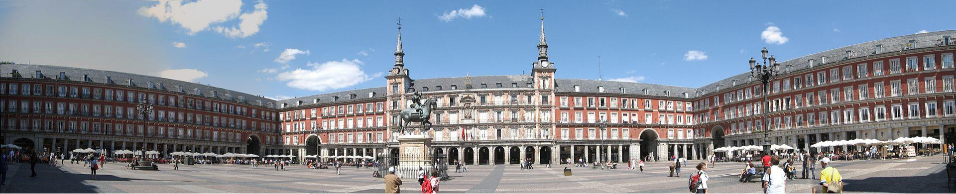
Plaza Mayor de Madrid. Juan Gómez de Mora. Reinado de Felipe III. 1617