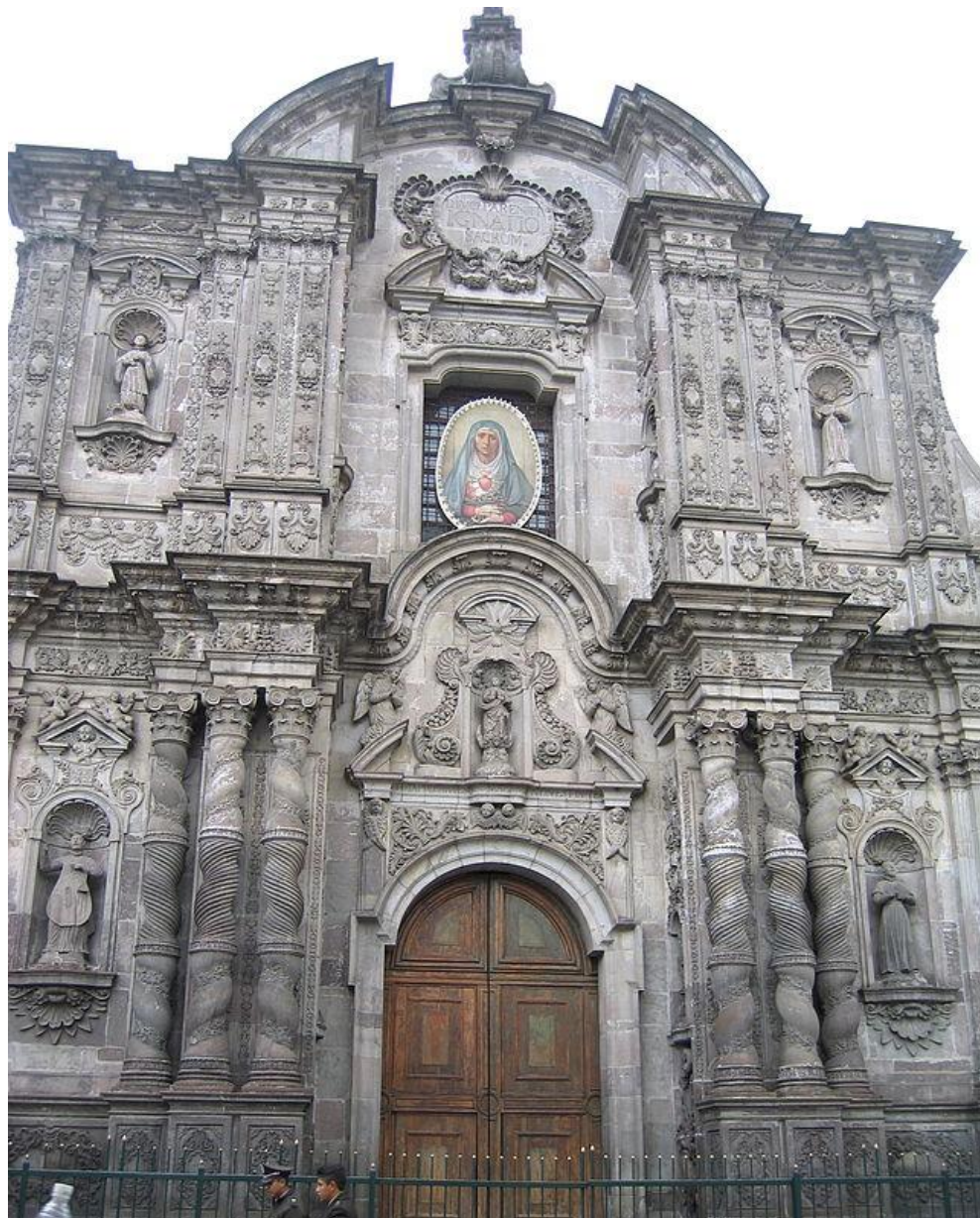
Iglesia de la Compañía de Jesús. Quito, Ecuador (1722-1765)