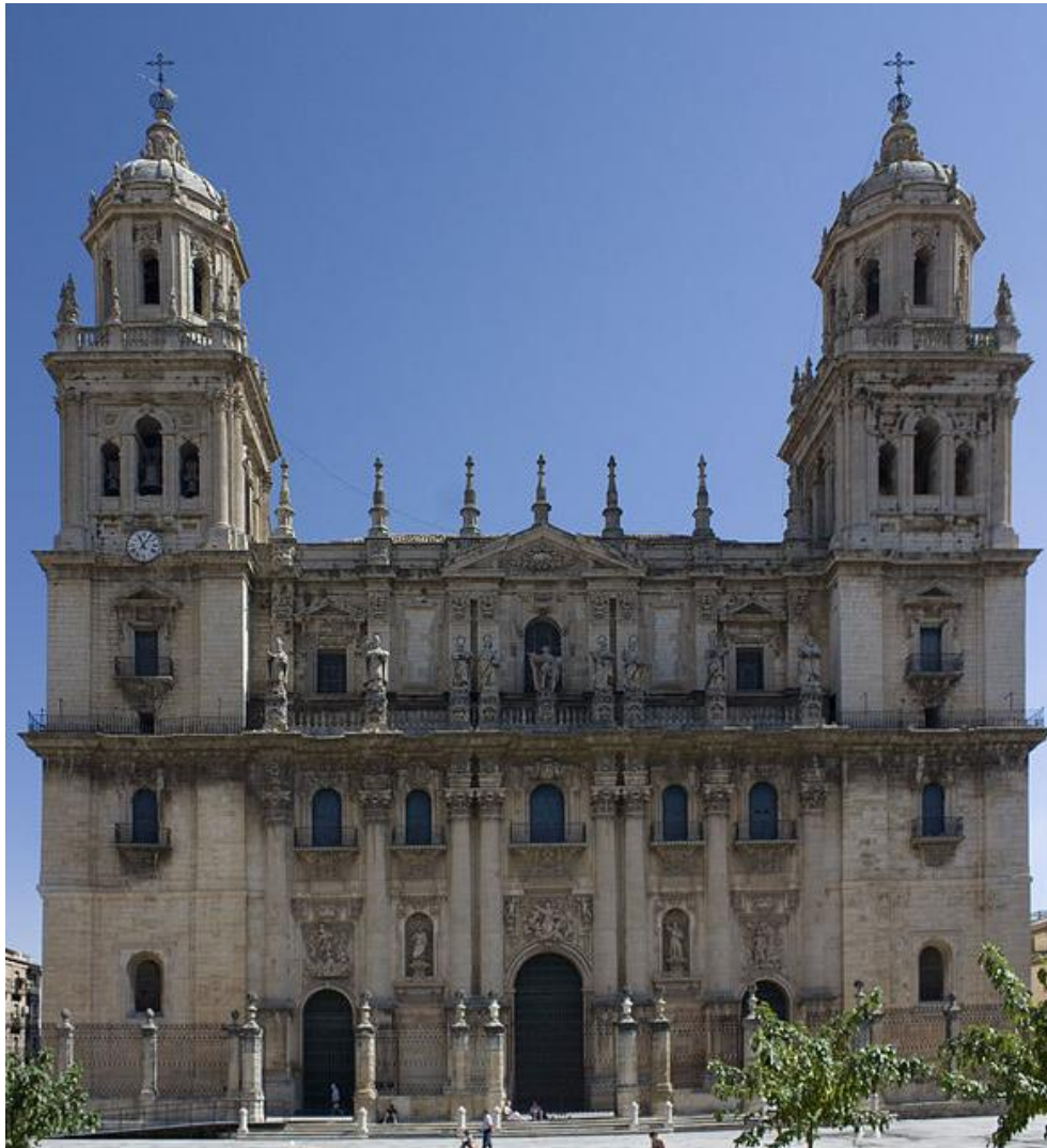
Fachada de la catedral de Jaén. López de Rojas.