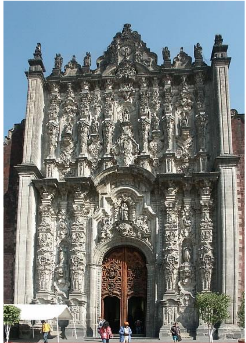
Fachada del Sagrario. Catedral de México. Lorenzo Rodríguez. 1749