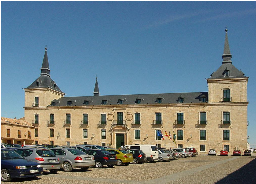
Palacio Ducal de Lerma(Burgos). Francisco de Mora 1601-1611