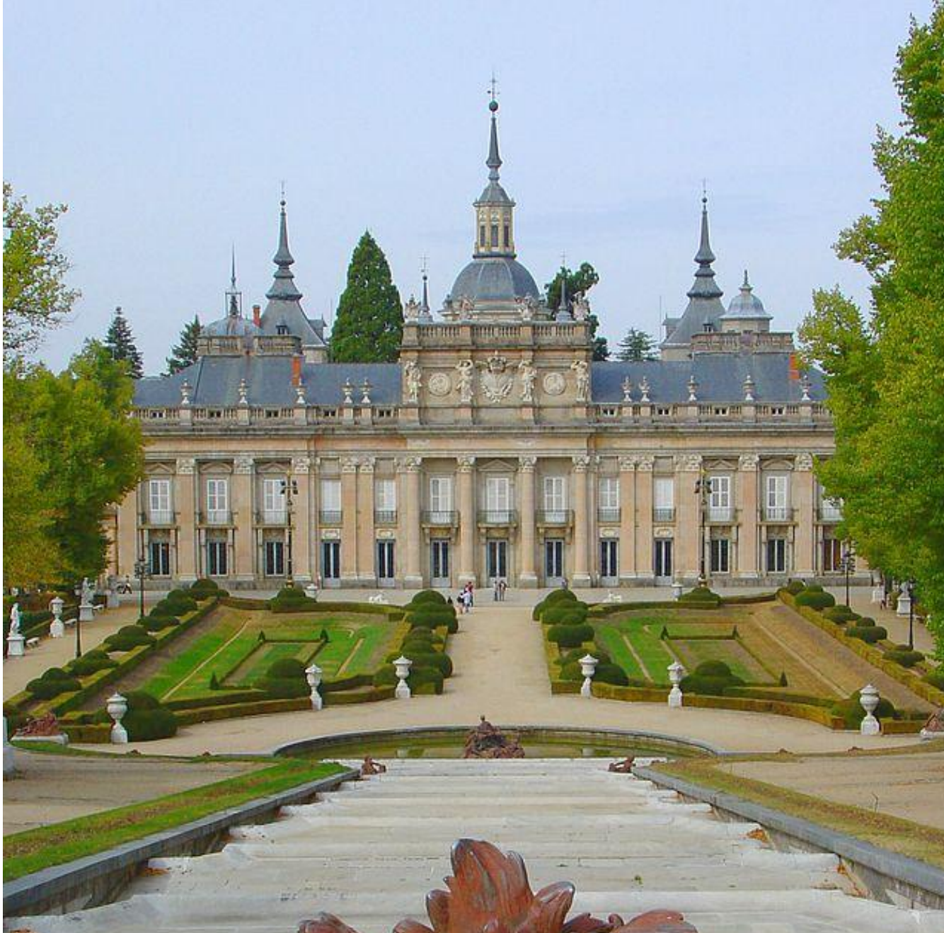
Palacio de la Granja de San Ildefonso. Planos de Teodoro Ardemans. 1721