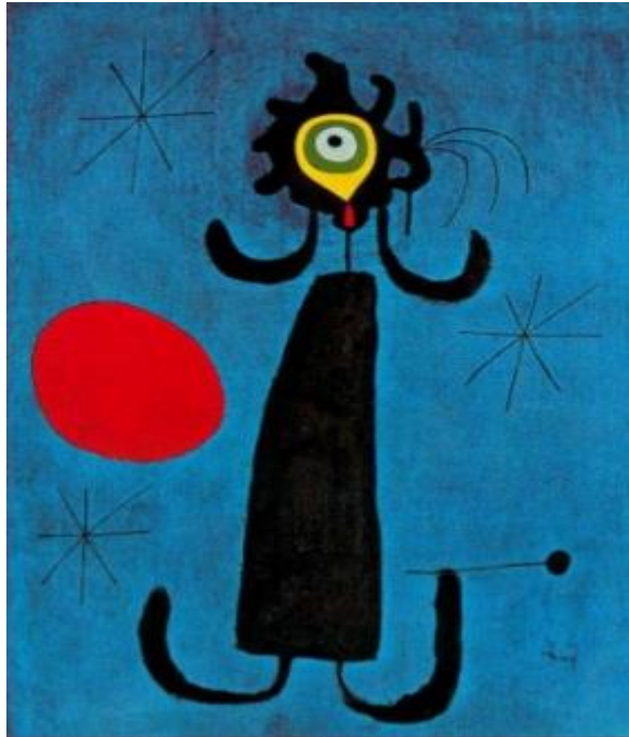
MUJER ANTE EL SOL