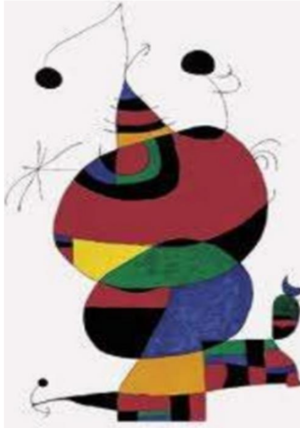
MUJER, PÁJARO Y ESTRELLA